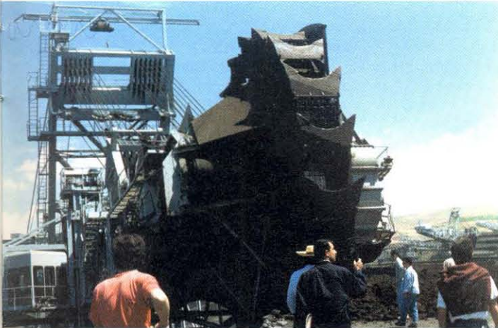
İnsan-Doğa ilişkisinde dengeler, endüstri yanına bozulmuş durumda

İnsan, yarattığı kirlilikle, sonuçlarına kendisinin de katlanmak zorunda olduğu bir dünyayı hazırlıyor. Bir Kızılderili reisinin söylediği gibi, "Beyaz adam, kendi çöpünde boğulacak" ve "kendisinden başka her şeyi yok edecek derecede amansız bir rekabete giren tür, sonuçta boş bir zafer kazanmış" olacaktır.